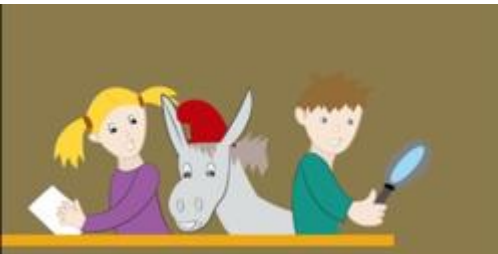
Les petits détectives du patrimoine découvrent Amélie-les-Bains-SE

Les enfants doivent aider Laïa, Pol et Ruc, les Petits Détectives du Patrimoine, à mener l'enquête dans les rues de la ville pour élucider un mystère grâce à l'observa