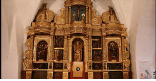
El retaule barroc : Encàrrecs i comitents

Aquest joc de rol ofereix la possibilitat de comprendre el paper dels diferents protagonistes implicats en la creació d'un retaule.