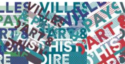
Raconte-moi les monuments aux morts des Vallées Catalanes